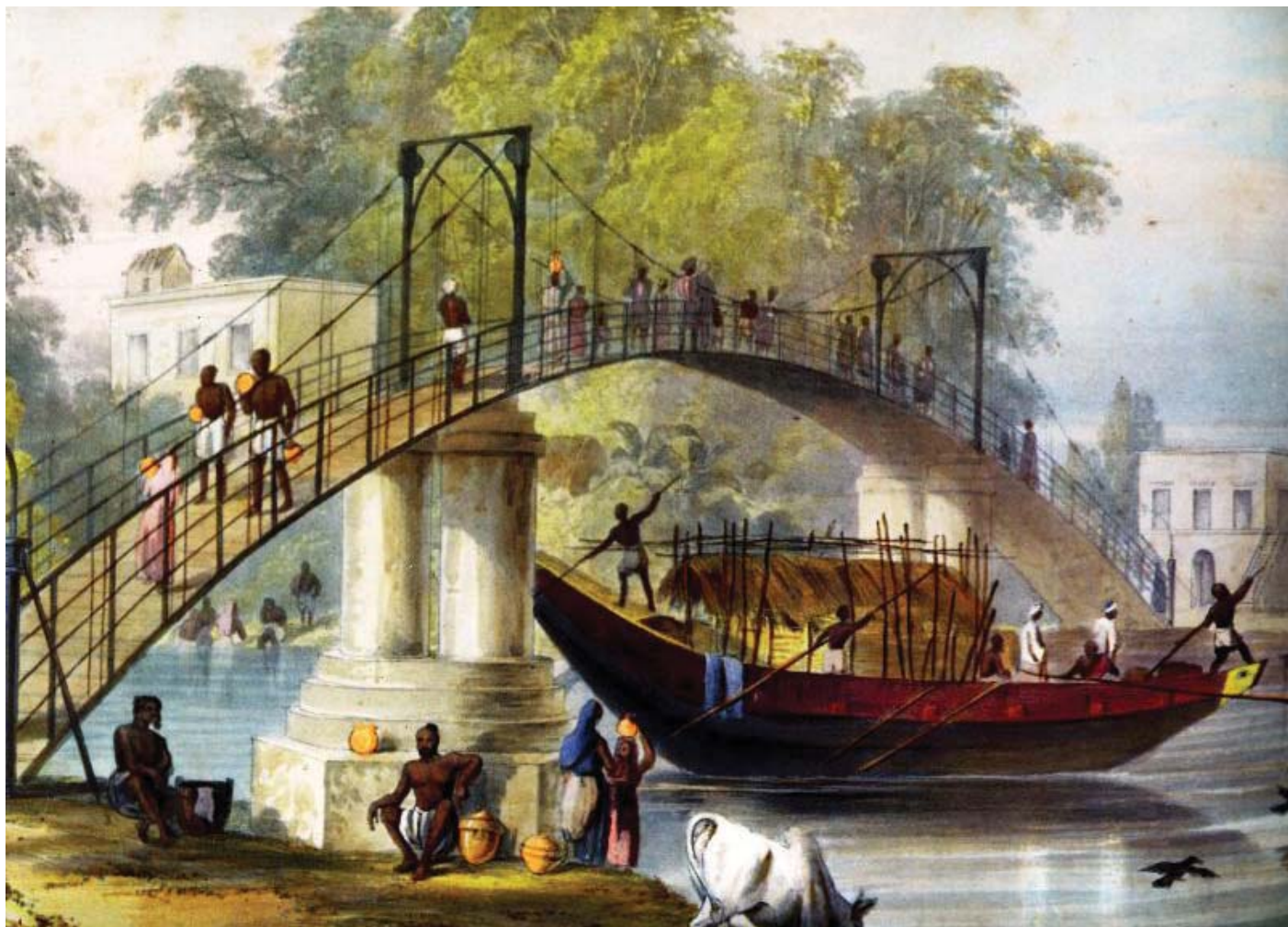
Такой была Калькутта во времена Герасима Лебедева.