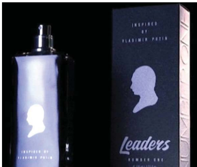
По материалам «Мой дом Москва».

Продавец-консультант сообщил, что это лимитированный выпуск аромата и он пользуется спросом. Приобрести 100 мл парфюма можно за 10 тысяч рублей. Такой же флакон в подарочной деревянной упаковке будет стоить почти в два раза больше — 19 тысяч рублей.