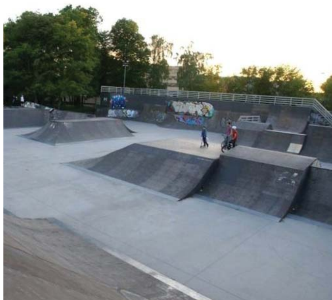
По материалам «Мой дом Москва».

Ранее на территории ЖК «Рассказово» было проведено озеленение. Здесь высадили более 80 деревьев и 7 тыс. кустарников, среди которых клены, яблони и сирень.