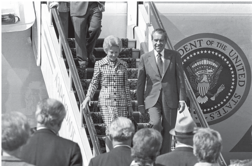
Никсон с супругой