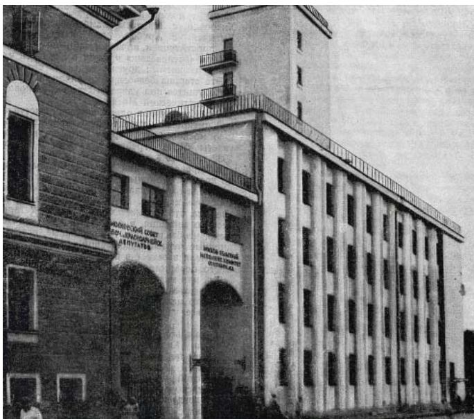
Арки, которые были снесены

После передвижки здание Моссовета было поставлено на фундаменты, рассчитанные на предстоящую надстройку в два этажа. В 1945 - 1947 годы под руководством главного архитектора столицы Дмитрия Чечулина здание было надстроено двумя этажами и приобрело современный вид. Чтобы старые стены нижних этажей выдержали нагрузку надстройки, их стянули массивным металло-кирпичным поясом, замаскировав его снаружи широким карнизом. Кроме того, каркас здания укрепили 24 металлическими колоннами. Нижнюю часть главного фасада дополнили пилястрами, а верхний ярус – восьмиколонным портиком. Центральный вход расширили, придав ему сходство с Триумфальной аркой. Стены декорировали барельефами работы скульптора Николая Томского и гербом СССР. Была переоборудована система центрального отопления и система вентиляции (смонтирована система кондиционирования воздуха). Кроме того, здание перекрасили из желтого цвета в темно-красный, выделив отдельные части белым.