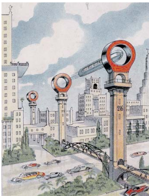
Москва будущего, открытка 1940-х годов, справа - непостроенный Дворец Советов.

Несмотря на «железный занавес», советские архитекторы и проектировщики внимательно приглядывались к зарубежному опыту. Архитектор Борис Иофанов «открывает Америку»: «Каждую стройку американцы начинают с благоустройства участка. Они прокладывают на месте строительства дороги, водопровод, канализацию. Даже разбивают цветники. И лишь после этого начинают возводить здание».