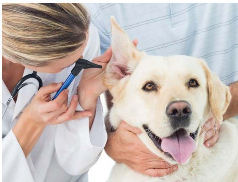
Фото из открытых источников. По материалам «Мой Дом Москва».

Вызвать ветеринара к своему питомцу можно по телефону: +7 (495) 612-04-25 (круглосуточно).