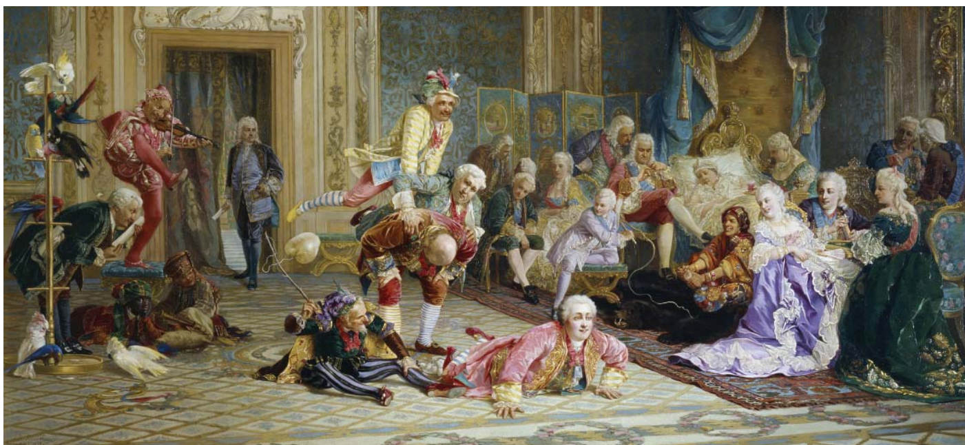
Шуты при дворе Анны Иоанновны