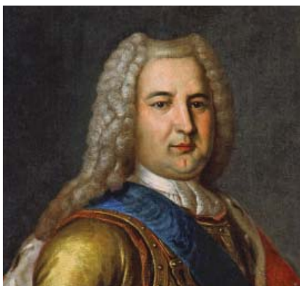
Герцог Курляндский Бирон

Возможности Бирона пользоваться богатствами страны в своих интересах были столь огромны, что даже пол в одной из комнат своего дворца он, что называется, «скуки ради», выложил поставленными на ребро серебряными рублями. К концу царствования Анны Иоанновны он не знал уже, чего хотеть. Помимо вышеупомянутого Рундальского дворца Бирон обзавелся еще одним, работы того же Растрелли, огромным дворцом в Митаве (ныне Елгава). При этом предусмотрительный герцог старался размещать свои богатства подальше от российских границ. Вклады предпочитал делать в германских банках.