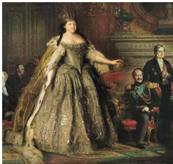
Анна и придворные