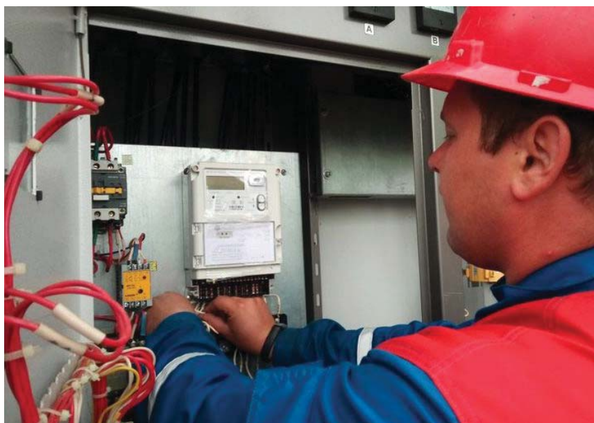
Фото Юлии СМАГРИНСКОЙ. По материалам «Мой Дом Москва».

«Россети Московский регион» содействуют реализации программы реновации в столице с 2017 года. За это время энергетики подключили к сетям 41 дом.