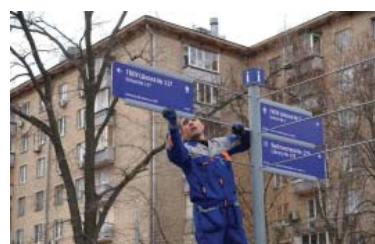
Фото Юлии СМАГРИНСКОЙ. По материалам «Мой Дом Москва».

Портал «Наш город» начал работу с 2011 года, за это время было решено более 3,8 миллиона городских проблем. Москвичи могут оставить сообщение о качестве работы служб городского хозяйства, поликлиник, транспорте и даже следить за ценами в аптеках.