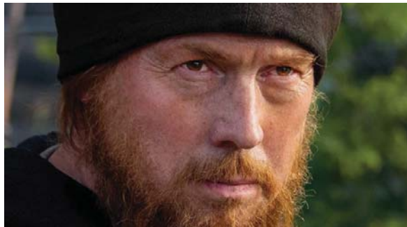
Виктор Сухоруков в роли Малюты Скуратова.