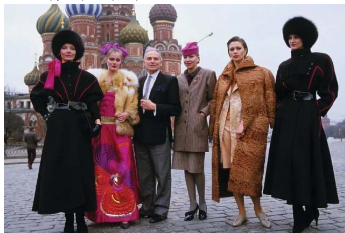
Пьер Карден в Москве. 1991 год.