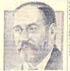
Менд, 6-го июля...