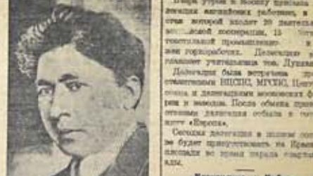
Премьер ЦКН Союза ССР тов. Шкист