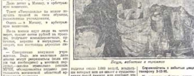
Вечер, забытые в трамвае...