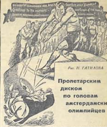
Рис. И. ГАТНАОВА

Пролетарским диском по головам амстердамских олимпийцев