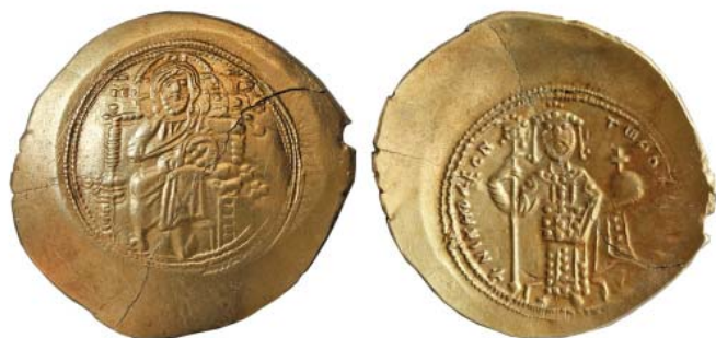
Гистаменон Никифора III Вотаниата (1078 - 1081).