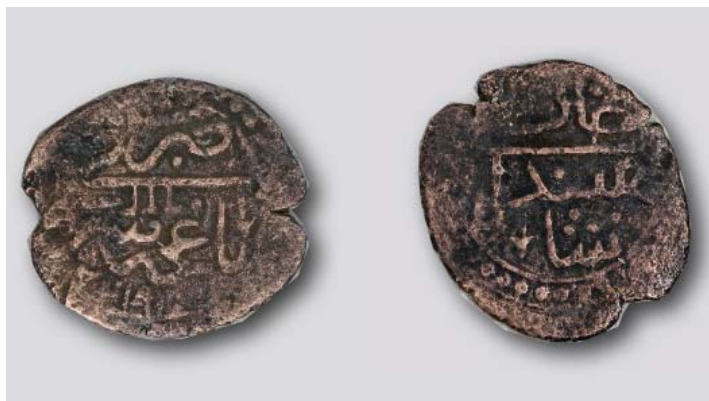
Бешлык третьего года правления хана Шахина Гирая.