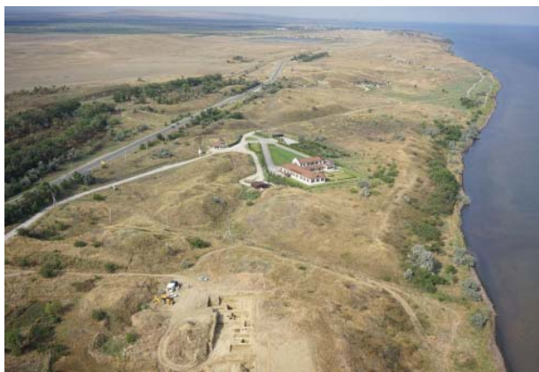
Фанагория, вид сверху на научный центр Фанагории и часть некрополя.

Шахин Гирай пытался провести в Крыму реформы по российскому образцу, в том числе и монетную. Не меняя названия монет, он увеличил количество серебра в бешлыках, которые на тот момент были мелкой монетой с большим содержанием меди.