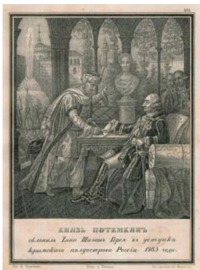
«Живописный Карамзин, или русская история в картинках, изданная Андреем Прево», Санкт-Петербург, 1844 год. Стр. 154.