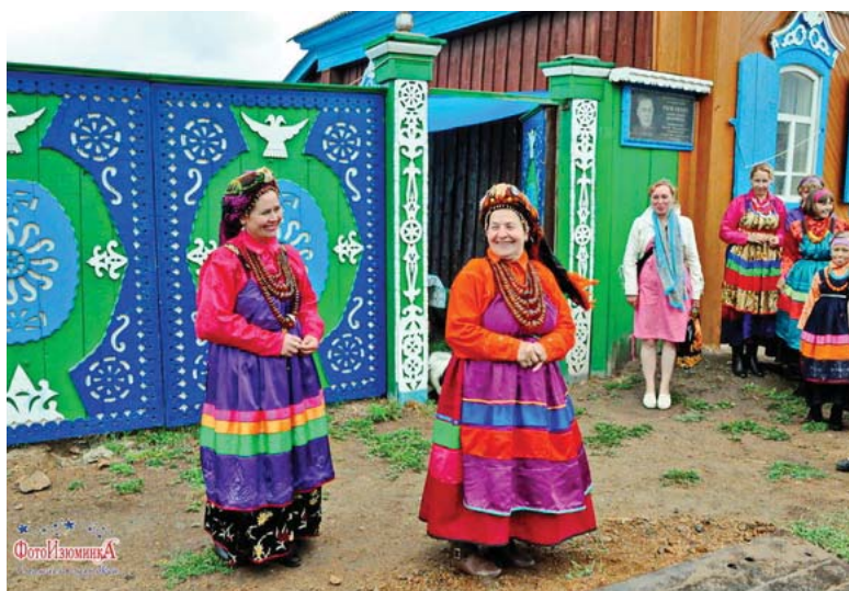
Жительницы села Большой Куналей.

Культура и непонимание, культура и противостояние – антиподы. Общественная атмосфера, обыкновенная сегодняшняя жизнь миллионов православных, которые в повседневности не разделяют себя по обрядам, в любом случае ввязываясь показывает бесплодность и бессмысленность многовековой, существующей и поныне распри в верхах. Таким образом, государственный политический курс окажет решающее влияние на позиции сторон, приведет к согласию и примирению церквей, 350 лет живущих в расколе.