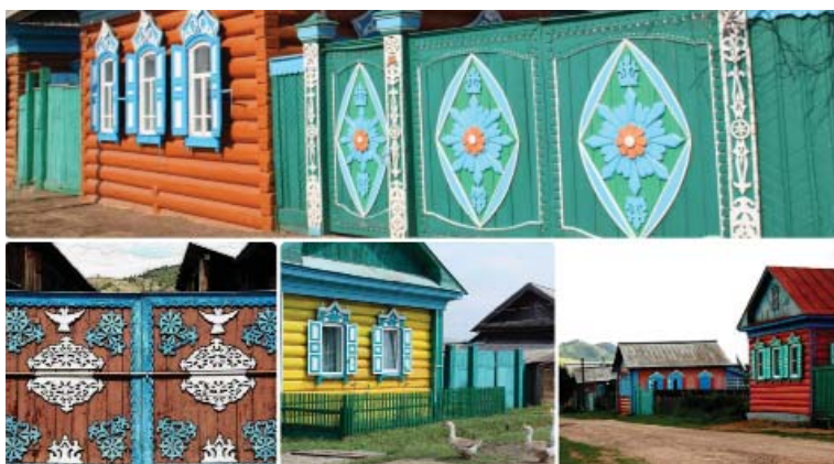
Дома староверов в бурятских селах.