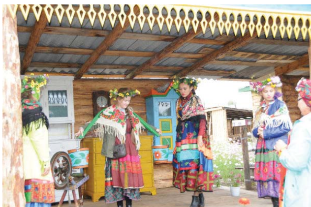
Девушки из села Десятниково.