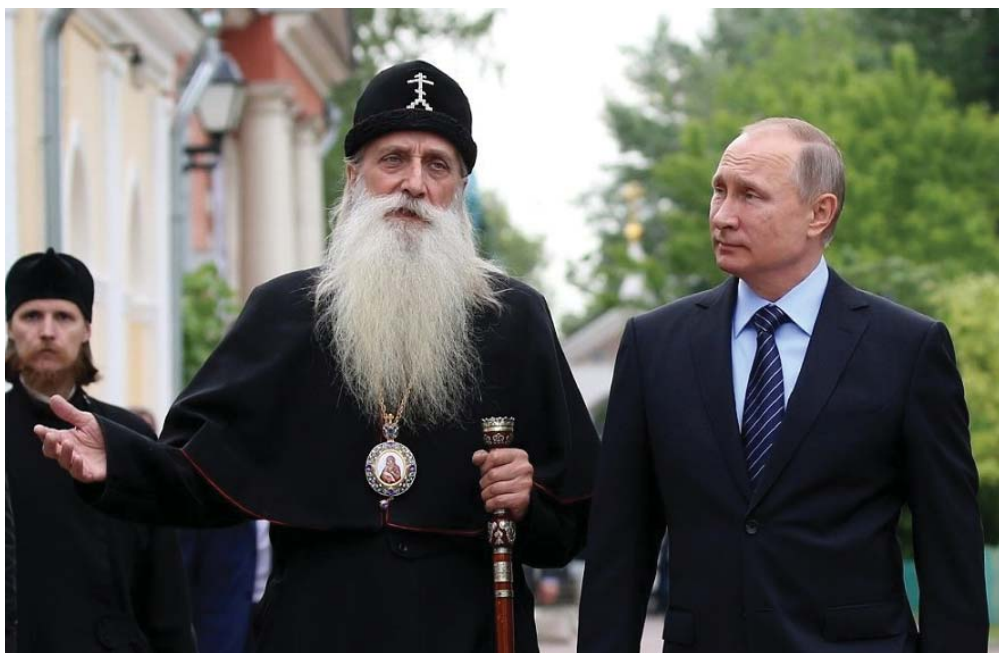
Глава Русской Старообрядческой Церкви митрополит Корнилий и президент РФ Владимир Путин.

При словах «старообрядческое село» и «старообрядческие нравы» тут же возникает стереотипная картина: что-то мрачное, темно-серое, аскетическое, некое сознательное ограждение от нашего общего мира, включая образование, достижения