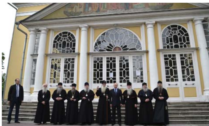
Путин и архиереи старообрядчества у Покровского собора в Рогожской слободе.