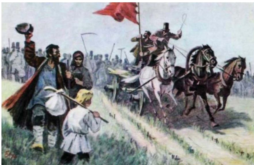
Восстание крестьян под красным флагом в Пензенской губернии, 1861 год.

160 лет назад, в 1861 году, в России отменили крепостное право. Хотя шеф жандармов А. Х. Бенкендорф предупреждал еще в 1839 году: «Крепостное право есть пороховой погреб под государством».