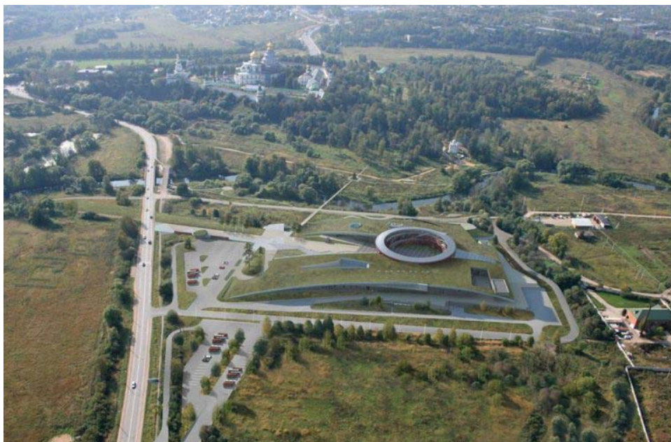
Музей «Новый Иерусалим»

А знаете ли вы, что у каждого из нас есть уникальная возможность попробовать себя в качестве детектива? Но детектива не совсем обычного, а детектива культурного? Причем не вставая с собственного дивана.