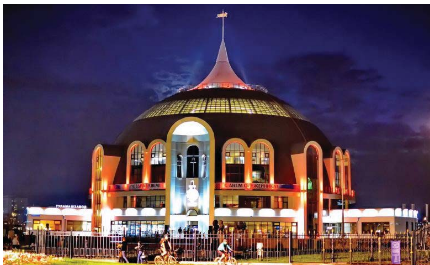
Тульский государственный музей оружия

Естественно, что авторы «Артефакта» ставили своей целью заинтриговать зрителей: после увиденного на экране каждый может продолжить собственное арт-расследование, воспользовавшись приложением. На