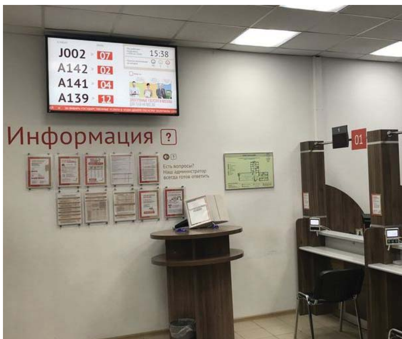
По материалам «Мой Дом Москва».

Срок оформления государственной услуги не изменился.