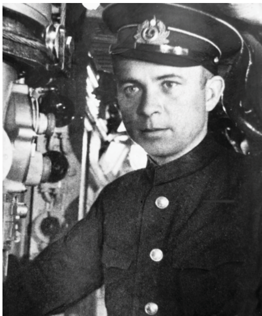
Командир С-13 Александр Маринеско