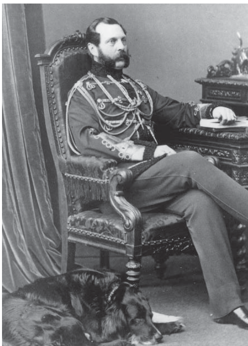
Император Александр II

Помещики, дворяне – опора престола. Значит, царь должен идти