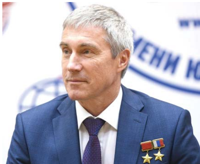
Фото С. К. Крикалева