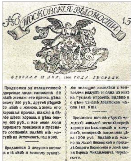
Объявления в газете о продаже крепостных

Велимир Хлебников в публичных выступлениях писал на листах: «Некто 1916».