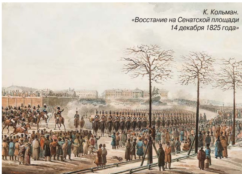
К. Кольман. «Восстание на Сенатской площади 14 декабря 1825 года»