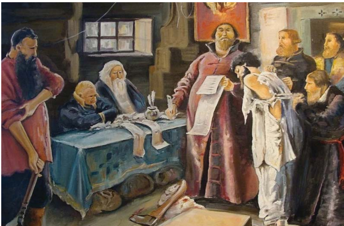
С. Иванов. «Суд в Московском государстве»

160 лет назад, в 1861 году, в России отменили крепостное право. Власть царской России до последних десятилетий защищала лишь права рабовладельцев и правящих сословий. Когда спохватилась, было уже поздно – грянула революция, которая провозгласила насилие как идеологию, «повивальную бабку истории».