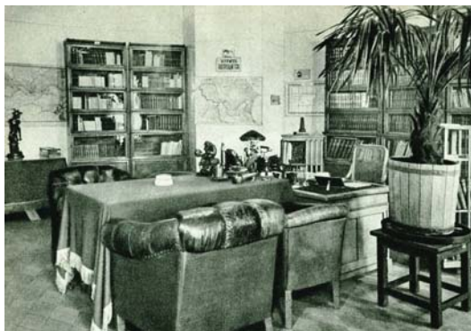
Кабинет Ленина в Кремле