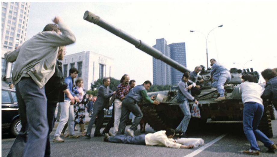
Народ на защите демократии и свободы в дни путча. Москва, 19 августа 1991 года.