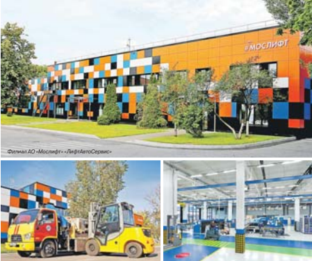
Фасад АО «Моссифт» в Липецке.

По информации пресс-службы Департамента культуры наследия г. Москвы.