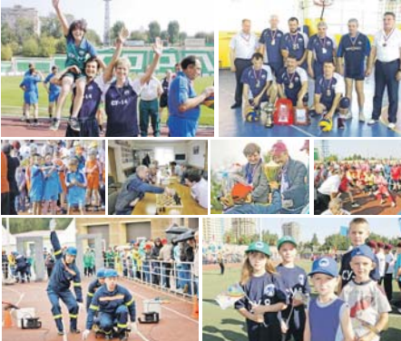
Варта АВАХИМ представляет акцию в рамках подпрограммы «Готовимся к будущему»