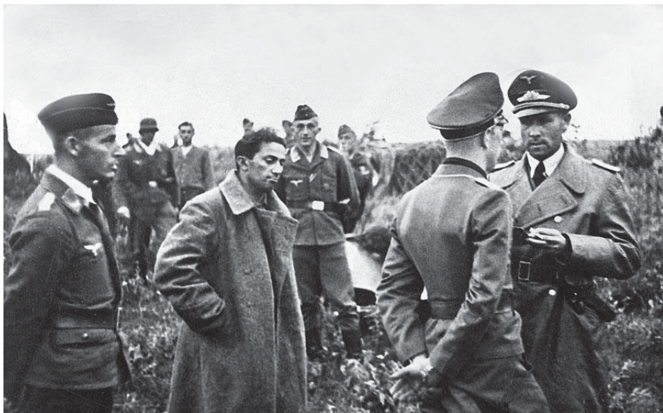
Яков Джугашвили в плену