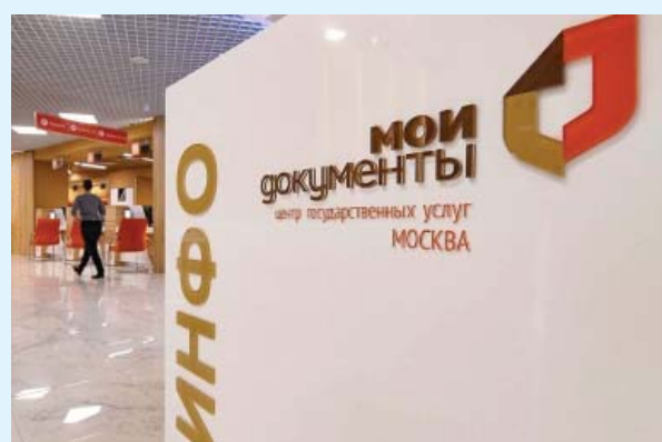
ГРАФИК РАБОТЫ ОФИСОВ «МОИ ДОКУМЕНТЫ» В МАЙСКИЕ ПРАЗДНИКИ

Десять праздничных майских выходных внесли коррективы в работу столичных центров госуслуг и Главного архивного управления города Москвы.