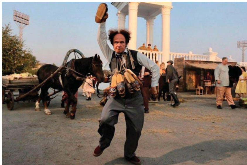
Кадр из фильма «Последняя «Милая Болгария»