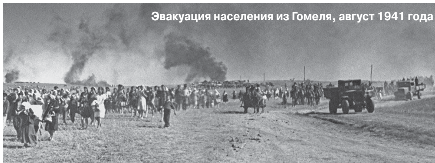
Эвакуация населения из Гомеля, август 1941 года