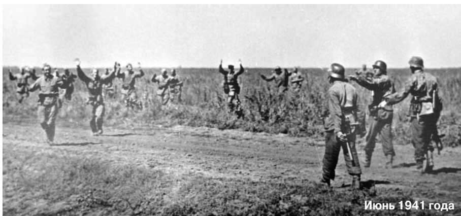
Июнь 1941 года

Итог известен. Поздним вечером 22 июня генерал-фельдмар-