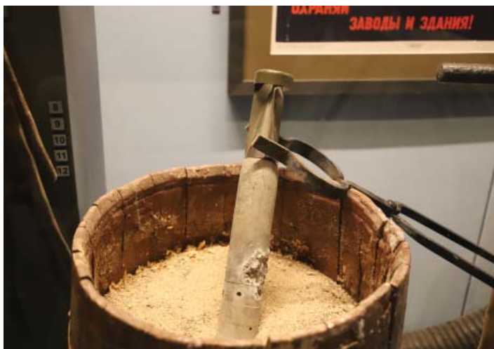
Одна из зажигательных бомб представлена в витрине.