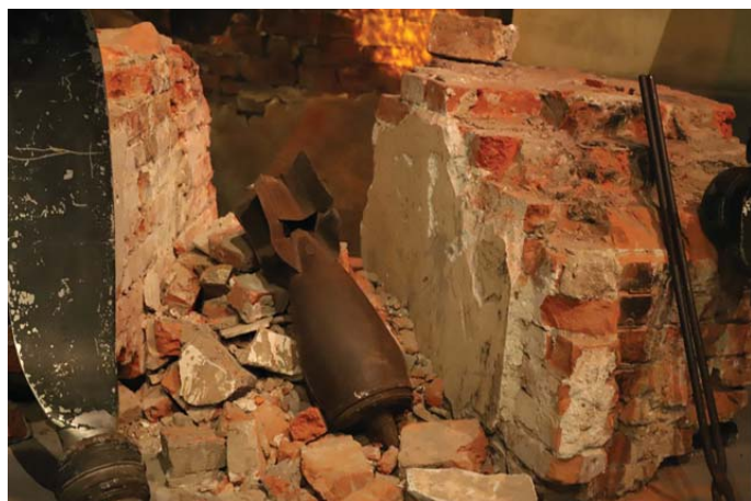
Рядом представлена бетонобойная бомба с острым наконечником, препятствующим углублению авиабомбы в грунт. Она не взорвалась при падении по причине неисправного детонатора.