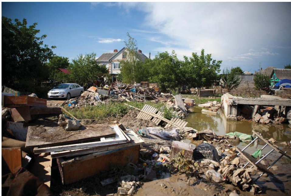
Крымск после наводнения, 2012 год

Очень странно, более чем странно, что при обсуждении Потопа-2021 почти никто не говорит о кардинальном решении вопроса, о гарантии безопасности на будущее. Последние 20 лет наводнений показали, что нам никакой урок – не впрок.