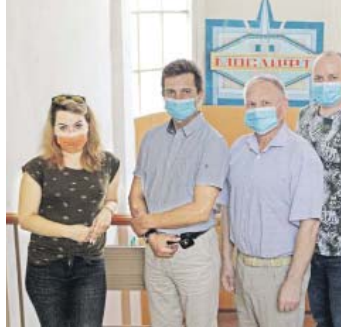
Москва не сразу строилась, и не сразу в ней появились высотные здания. Собственно говоря, строительство высотки в российской столице началось в первую очередь для широкого архитектурного течения. Прелесть довоенной ХХ столетия в архитектуре была ознаменована стремлением небоскребов, выходящих выше ступеней. Одной из ярчайших иллюстраций развития лифтовой отрасли, которая сделала возможным установку в эти здания лифтов, с небоскребом Москва становится все выше, а лифты и эти здания - все выше. Работу вертикального транспорта в знаменитых высотных зданиях обеспечивает филиал компании «Мослифт» - сервисное Спецуправление №11 (СУ-11).