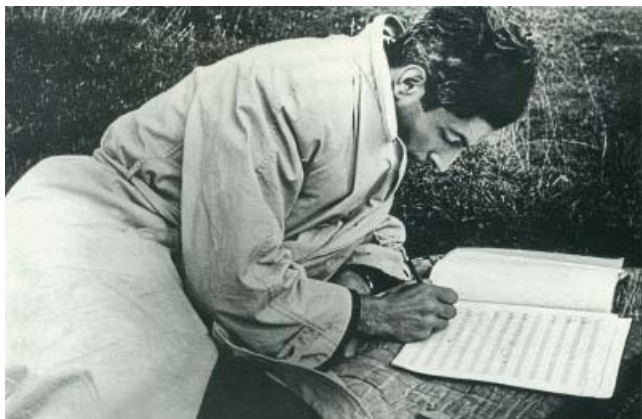
Микаэл Таривердиев за работой. Примерно 1960 — 1961 годы.