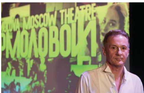
Художественный руководитель Московского драматического театра имени М. Н. Ермоловой Олег Меньшиков во время традиционного сбора труппы перед началом 94-го театрального сезона в 2019 году.

Естественно, подобная ситуация не могла остаться без вни-