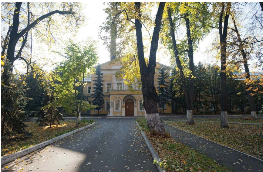
Преображенская психиатрическая больница.