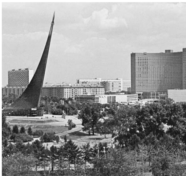
Наум Грановский. Вид на гостиницу «Космос» и монумент «Покорителям космоса». 1979

Елена БУЛОВА. Фото из фондов Галереи Люмьер.