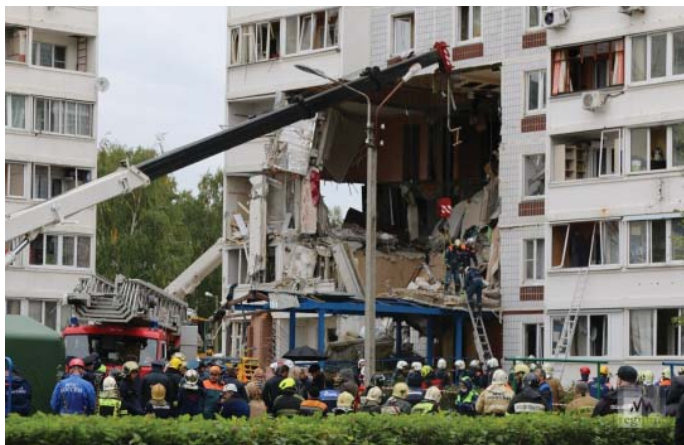
Последствия взрыва газа в Ногинске.

Взрывы бытового газа уносили и будут уносить сотни человеческих жизней, потому что этот конвейер смерти никто не останавливает.