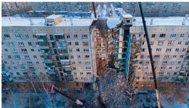
Последствия взрыва газа в Магнитогорске.

То есть денег таких у государства нет. И не ждите. Разумеется, подобные слова в чиновных ответах не употребляются. Вместо них: