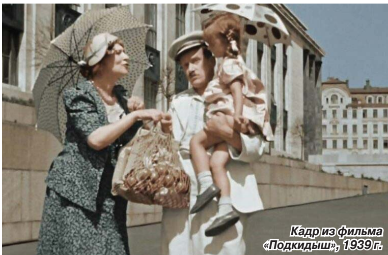
Кадр из фильма «Подкидыш», 1939 г.

И, справедливости ради, стоит сказать, что сегодня авоськи входят в моду у экологически продвинутой молодежи. Забытый атрибут советского прошлого пока менее популярен, чем сумки-шопперы, но тоже иногда используются в пику загрязняющему природу пластику.