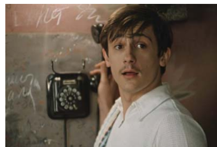
Кадр из фильма «Покровские ворота», 1982 г.

О, сколько же волшебных минут проводили наши родители, а потом и мы, уткнувшись носом в угол коридора коммунальной квартиры, где висело это чудо техники! Сколько признаний, вздохов, откровений слышали эти незатейливые аппараты. Обои возле телефона десятилетиями выполняли роль записной книжки: на них карандашом записывали телефонные номера, и даже карандашик висел на гвоздике рядом. Хорошо помню, что на нашем черном, тяжелом, висящем на стене телефоне были не только цифры на циферблате, но и буквы. Такие выпускались до 1968 года в Советском Союзе: телефонные номера состояли тогда не только из цифр. Первыми символами комбинации являлись буквы. Диктуя телефон, мы говорили, например: АЖ1-34-73. Буквы использовались следующие: А, Б, В, Г, Д, Е, Ж, И, К, Л. Такие, как З, Ё, Ы отсутствовали. Символ З был похож на тройку (цифра 3), путаницы стремились избегать, а до остальных букв дело просто не доходило – диск был рассчитан на 10 позиций.