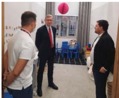
Мой социальный центр «Ломоносовский»