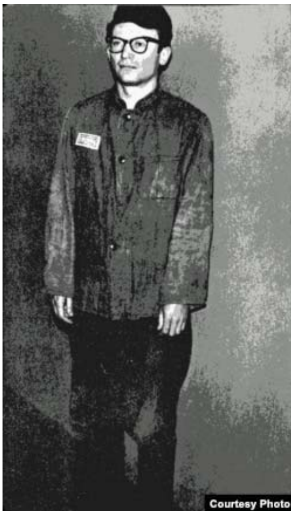
Андрей АМАЛЬРИК в лагере

Советский Союз держался на коммунистической идее, на идеологии. И на партийно-бюрократической тоталитарной системе. Но прежде всего – на идеологии, на которой был основан свод почти неизменяемых правил. С годами идеология стала