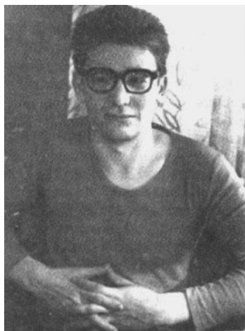
Андрей Амальрик и обложка книги «Просуществует ли Советский Союз до 1984 года?», Нью-Йорк, 1969 год.

Называлась книга «Просуществует ли Советский Союз до 1984 года?». На русском языке впервые, в 1969 году, опубликована в Амстердаме, Голландия, в том же году на английском – в Нью-Йорке, США.