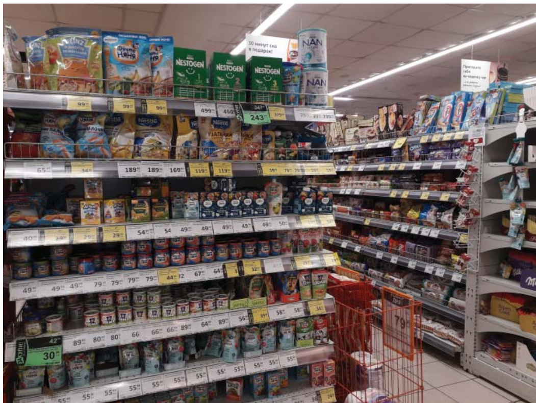
Таблица цен в сетевых магазинах Москвы (в рублях)