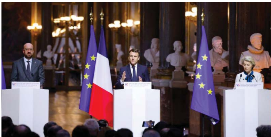
Председатель Европейского совета Шарль Мишель, президент Эмманюэль Макрон и глава Еврокомиссии Урсула фон дер Ляйен на саммите в Версале 11 марта 2022 года

Канадский политический аналитик Патрик Армстронг еще более жесток в оценке действий стран ЕС и США: «Мы являемся свидетелями краха триумфализма после «холодной войны», «конца истории», «унилатерализма». Реальность кусается, и кусается сильно... Для Запада прежняя жизнь кончена. Путаница, бред, хватост-