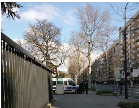
Полицейская машина у здания российского посольства в Париже

бившие все сектора французской экономики. Введенные против России санкции лишь усугубят положение, ударив по французским компаниям и их сотрудникам, ведь Франция является крупным работодателем и вторым по величине иностранным инвестором в России, где базируются 35 компаний САС40, включая Renault, Total Energies, Société Générale, Auchan, Alstom и Safran. Так что инфляция, и без того рекордно высокая в США и еврозоне (7,5% и 5,1% в январе этого года), в ближайшее время достигнет новых высот.