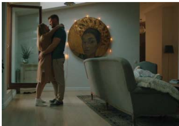
Кадры из фильма предоставила PR-служба картины.