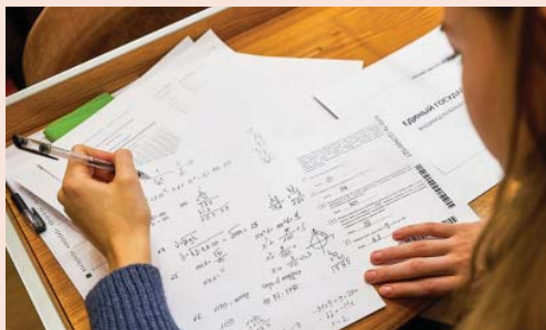
Мона ПЛАТОНОВА.

До 8 апреля проходит общественное обсуждение проекта этого приказа.