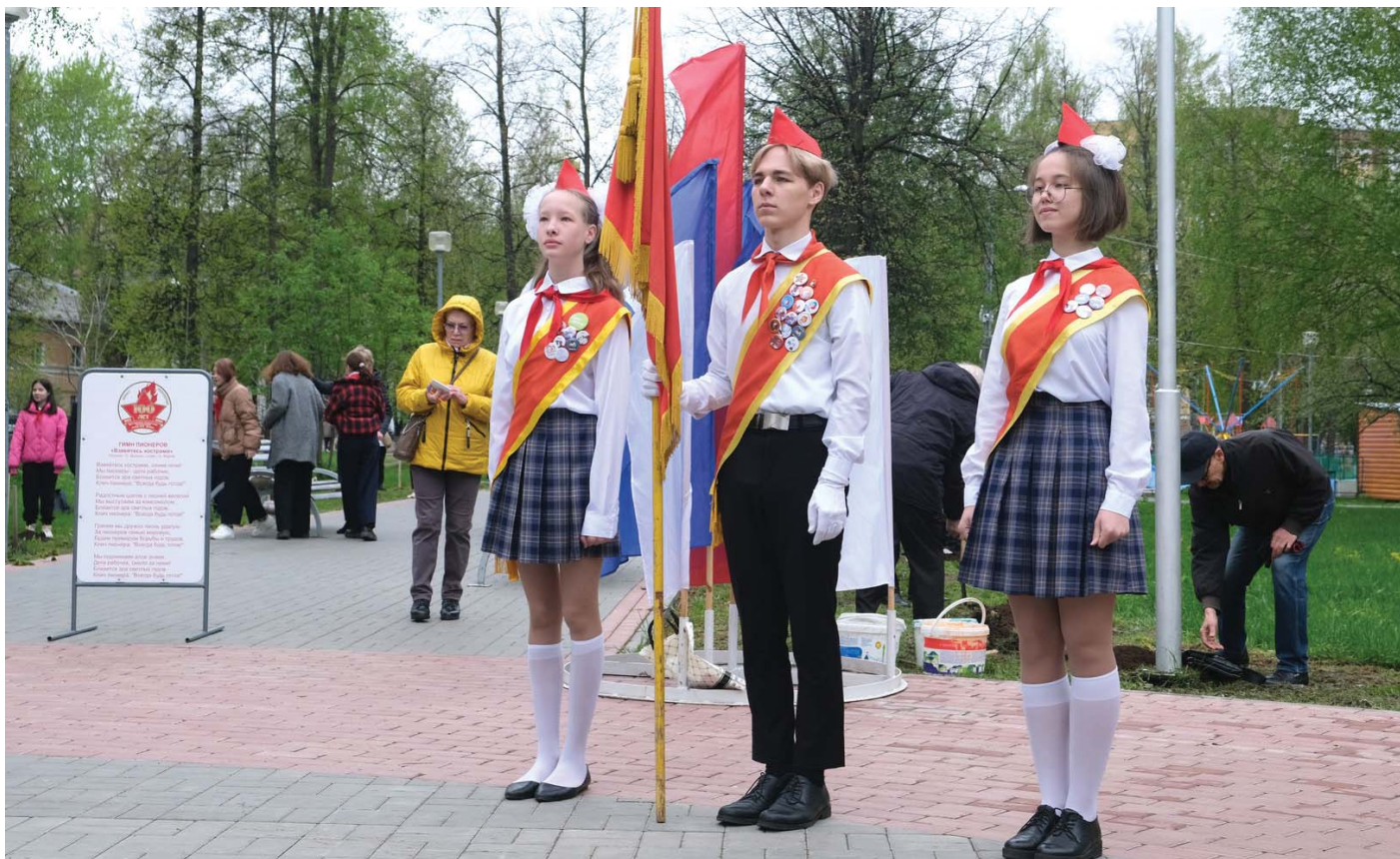
Фото РО ДОСААФ Республики Марий Эл.